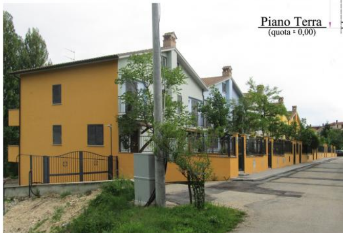
VISTA SU VIA PINCHERIE